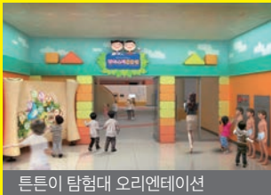
튼튼이 탐험대 오리엔테이션