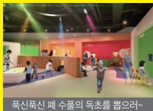
꼭싹꼭싹 폐수물의 독초를 뽑으려~