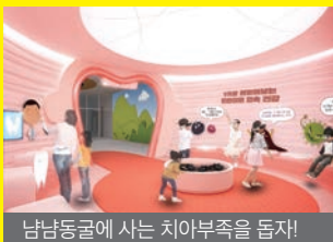
남남동굴에 사는 치아부족을 돕자!