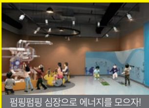
펄펄펄 심장으로 에너지를 모아자!