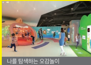
나를 탐색하는 오감놀이