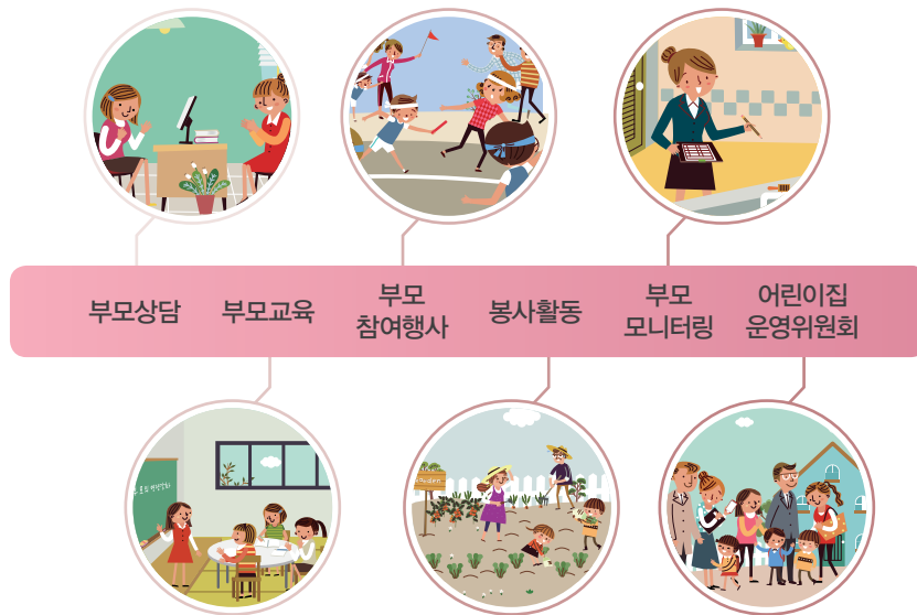
[어린이집 부모 참여]