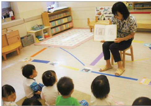
책 읽어주는 엄마